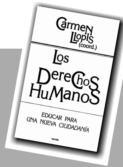
LOS DERECHOS HUMANOS Educar para una nueva ciudadanía Carmen Llopis (Coord.)

15015 Vinuesa (Comp.): DERECHOS HUMANOS: INSTRUMENTOS INTERNACIONALES, 1986, 824 págs., $ 32.844.- 20745 Zaffaroni: MUERTES ANUNCIADAS (SISTEMAS PENALES Y DERECHOS HUMANOS), 1993, 166 págs., $ 15.946.- 90909 Zumaquero-Bazan (Eds.): TEXTOS INTERNACIONALES DE DERECHOS HUMANOS (II) 1978-1998, 1998, 2.140 págs., $ 139.706.-