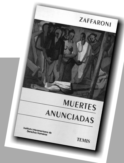
MUERTES ANUNCIADAS (Sistemas Penales y Derechos Humanos) Eugenio Raúl Zaffaroni

El análisis de los sistemas penales latinoamericanos, teniendo como factor de referencia los derechos humanos tal como ellos resultan de los instrumentos internacionales y de las normas constitucionales vigentes, constituía una tarea impostergable para el (IIDH). Con ese fin se diseñó un programa de investigación sobre sistemas penales y derechos humanos en América Latina, que colocó bajo la lúcida coordinación del Prof. Eugenio Zaffaroni y que ha sido nutrido invaluable contribución de un importantísimo número de académicos, funcionarios de los sistemas judiciales e investigadores de todo el continente.